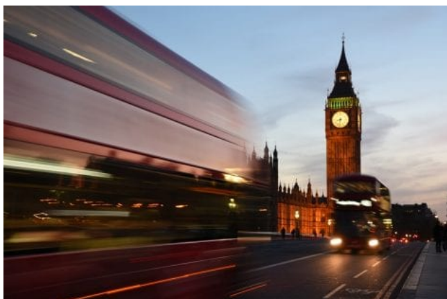
Meno vino italiano nel Regno Unito? “Colpa” della triangolazione