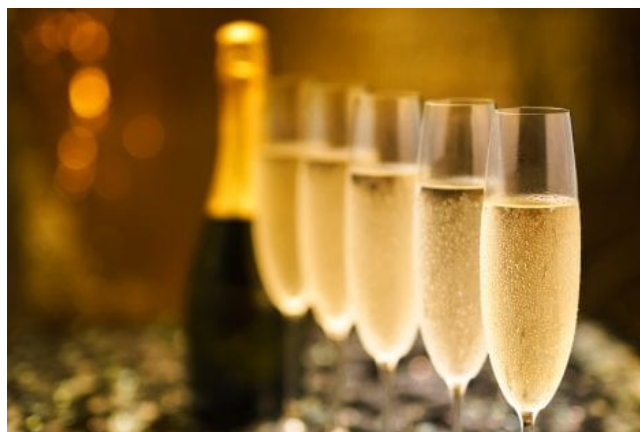
Regno Unito: stop agli aumenti sul vino. Sollievo per lo spumante italiano